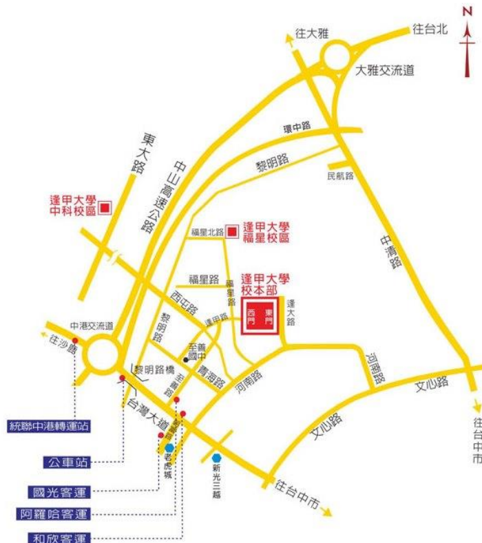
逢甲大學地理位置