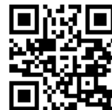
導航地圖 QR Code