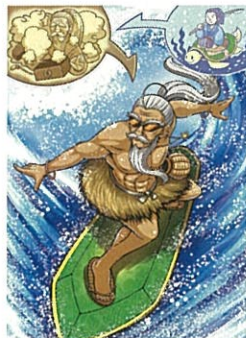
一般組(1頁漫畫)「東山再起」 作品名:TARO URASHIMA 筆名:Kitaoka Mitsuru (日本)