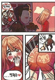
高中組「真棒！」 作品名:帥氣內褲 筆名:遊人(韓國)