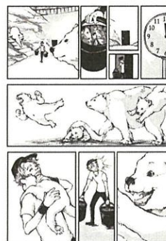
一般組(故事漫畫)主題自訂 作品名:You are my best gift 筆名:Akimichi(俄羅斯)