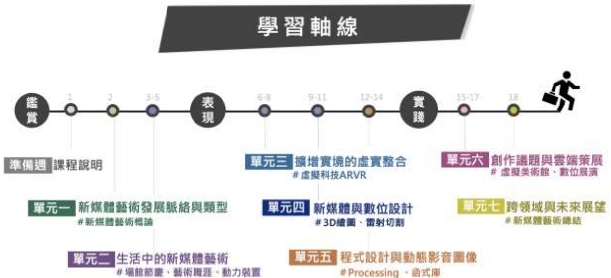
新媒體藝術線上課程單元進程圖