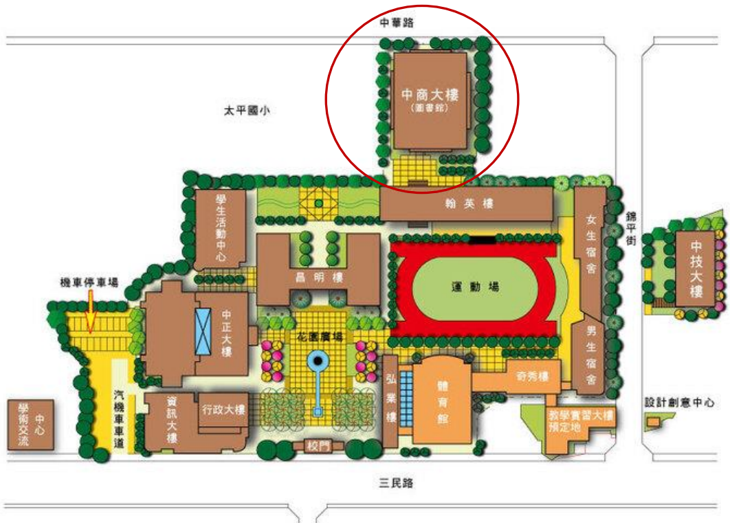
國立臺中科技大學校園地圖