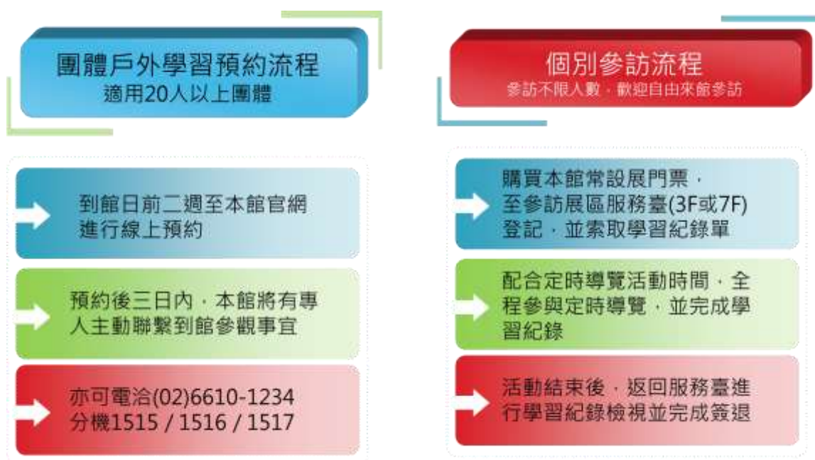
圖四 環境教育課程活動預約流程