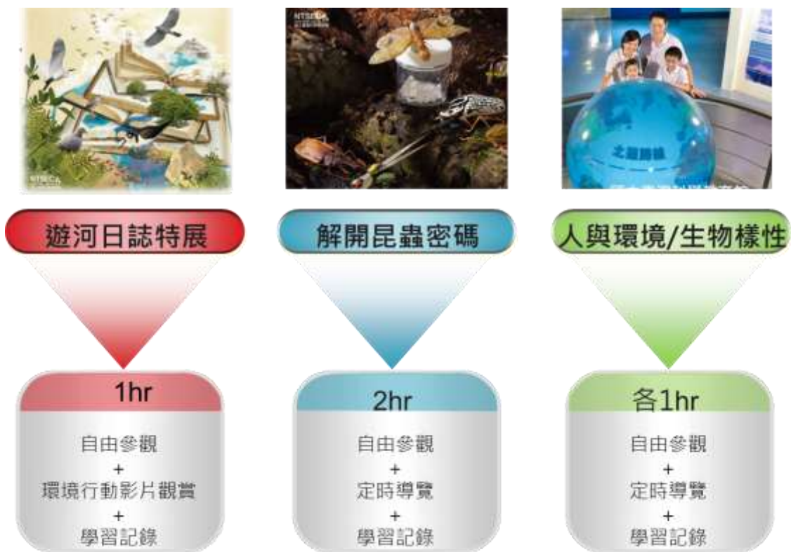
圖三 環境教育個別參訪方案說明