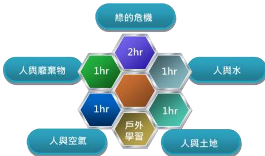
圖二 戶外學習環境教育課程方案