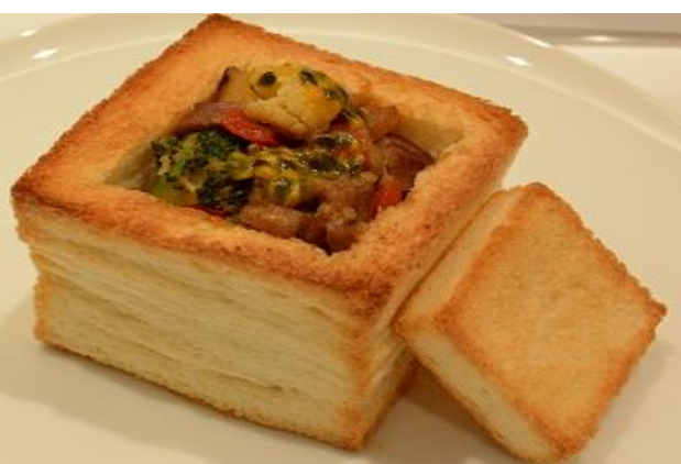
由專業業者將學生參賽菜單商品化呈現