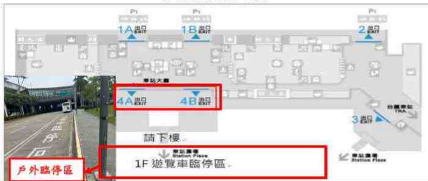
臺中高鐵接駁地點示意圖